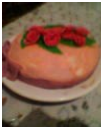
Ильвина Галлямова, 6 а « Моя мама такая молодец! На праздник, который мы провели в классе, она испекла вот этот торт. Он понравился всем!»